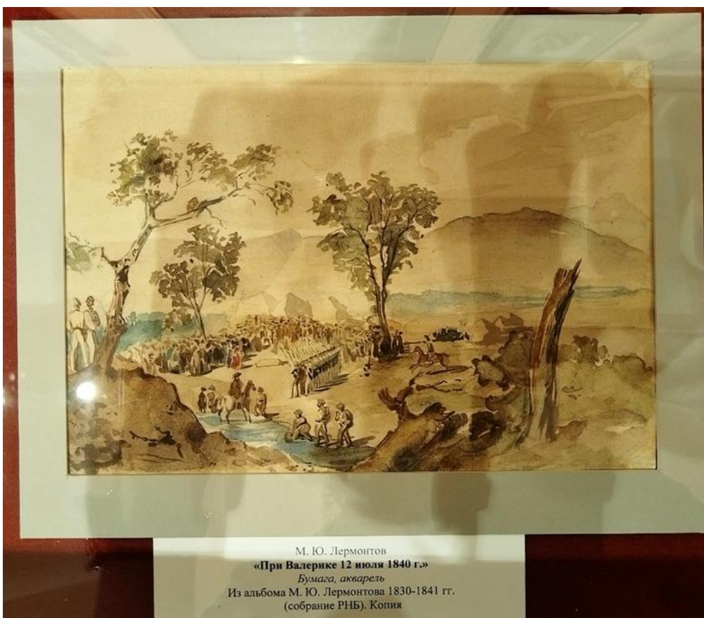
М. Ю. Лермонтов «При Валерике 12 июля 1840 г.» Бумага, акварель Из альбома М. Ю. Лермонтова 1830-1841 гг. (собрание РНБ). Копия