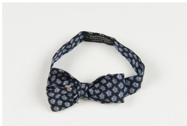
Рис. 7. Галстук-бабочка (Париж, 1920-е гг.)