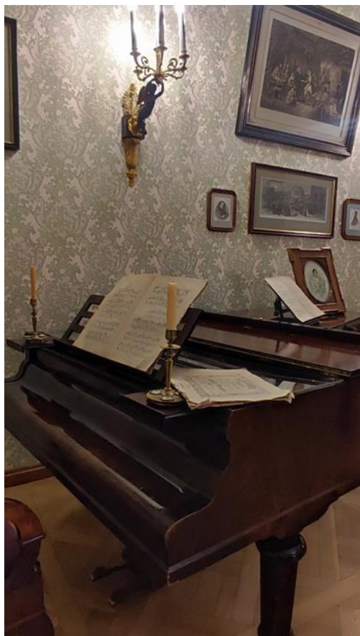
Рис. 3 Рояль в комнате А.Я. Панаевой