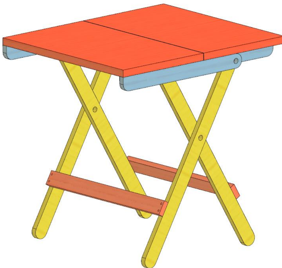
Рис. 1. «Складной стул» в собранном виде

Объект: «Складной стул». Необходимо создать объект, отличающийся от образца (см. рис. 1-3) как по дизайну, так и по цвету.