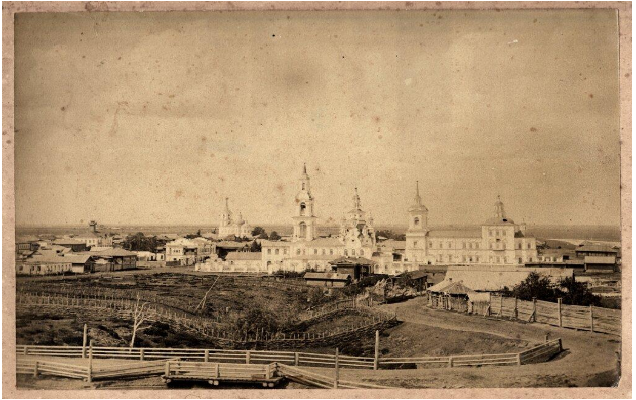
Г. Туринск. Вид с Косогорной улицы (1890-е гг.).

«На Ирбитской ярмарке присутствовали купцы из обеих частей Сибири, но численное преимущество было у представителей Западной Сибири. Если обратиться к губерниям, то первенство принадлежало городскому купечеству Тобольской губернии, на которых приходилось в 1814 г. - 26,6%, в 1816 г. - 16,3% от общего числа. В Ирбите в 1814 г. на ярмарке торговало 77 купцов из 8 городов указанной губернии (Ишим, Курган, Омск, Тара, Тобольск, Тюмень, Туринск, Ялуторовск), в 1816 г. из 10 городов (дополнились к первому списку - Березово и Сургут). На Ирбитскую ярмарку приезжали тобольские купцы (1814 г. - 24, 1816 г. - 43 человека), тюменские (12 и 11), ишимские (30 и 4), туринские (3 и 6), тарские (1 и 6) курганские (4 и 1), ялуторовские (2 и 1), омские (1 и 1), березовские и сургутские (1816 г. по 4 человека). Так, все города Тобольской губернии были представлены собственным купечеством, что обеспечивало местный рынок товарами из Ирбита».