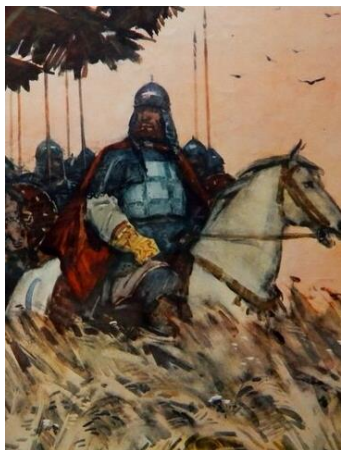
Рис. Н. Кочергина