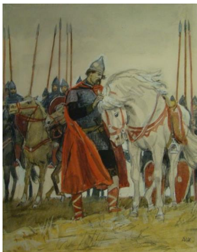
Рис. А. Бубнова