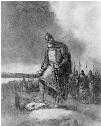
Рис. В. Васнецова