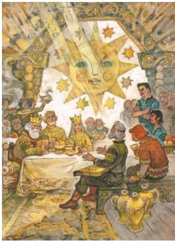
Рис. А. П. Могилевского