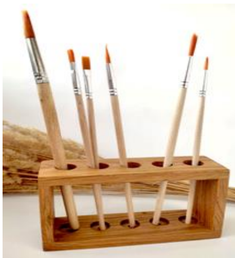
Рисунок 1. «Подставка для кисточек»

Габаритные размеры изделия: 10x40x90 (мм). Предельные отклонения размеров \pm 1 мм.