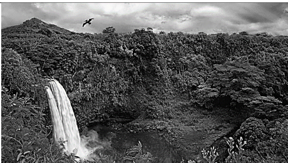
В. Объект ЮНЕСКО, национальный парк Ноэль-Кемпфф-Меркадо