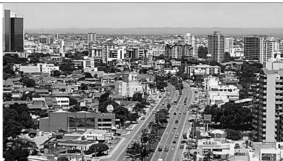
Г. Крупнейший по численности населения город страны