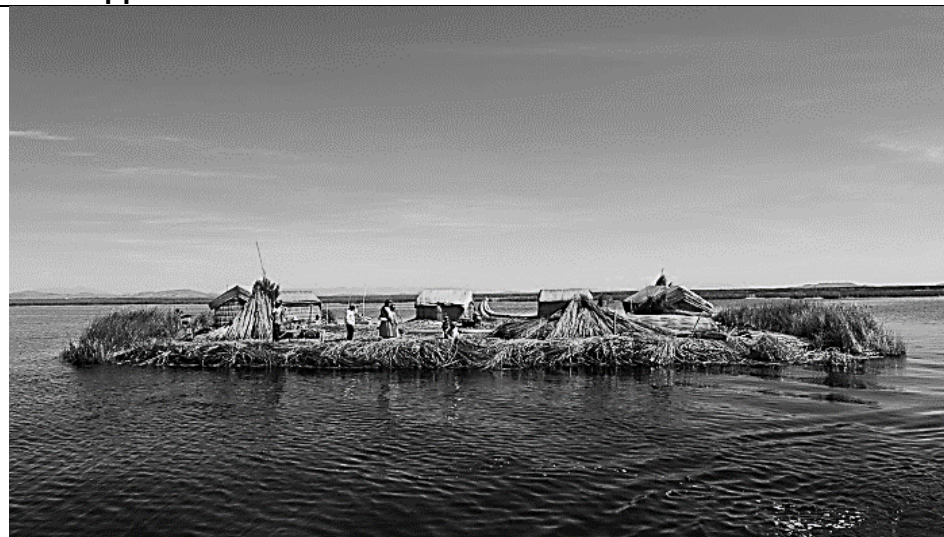
Б. Самое высокогорное судоходное озеро мира (крупнейшее по запасам пресной воды на материке) и островные жилища народа уру