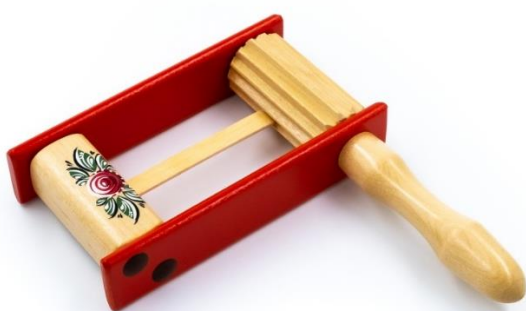
Рис.1 – Музыкальный инструмент «Трещотка»

Изделие: Модель музыкального инструмента «Трещотка»